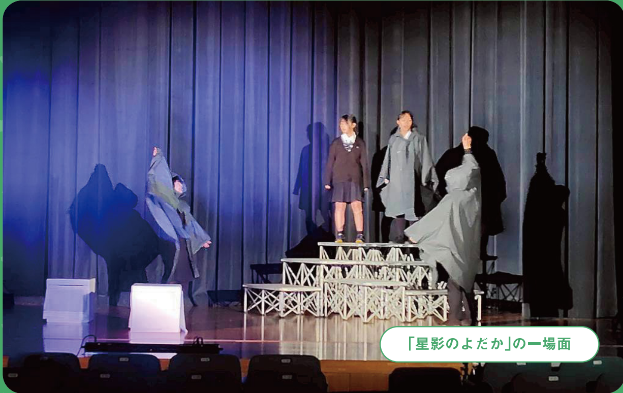
「星影のよだか」の一場面