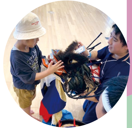
*「仙台げいのうの学校」の取り組みなどから

仙台市や周辺地域には、仙台文化から生まれた固有の「げいのう」(郷土芸能)がたくさん伝わっています。そして、大都市仙台には全国各地から、世界各国から、いろんな「げいのう」人が集まっていることがわかってきました*。仙台の「げいのう」の層の厚さは伊達じゃない。多様な「げいのう」人たちが集まって話し語りをしたら、次世代に受け渡せる新しいアイデアやつながりが創れるかも？次世代系の郷土芸能トークイベントでキックオフします。