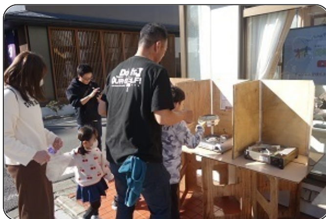
▲誰でも参加できるコーヒー焙煎部の様子