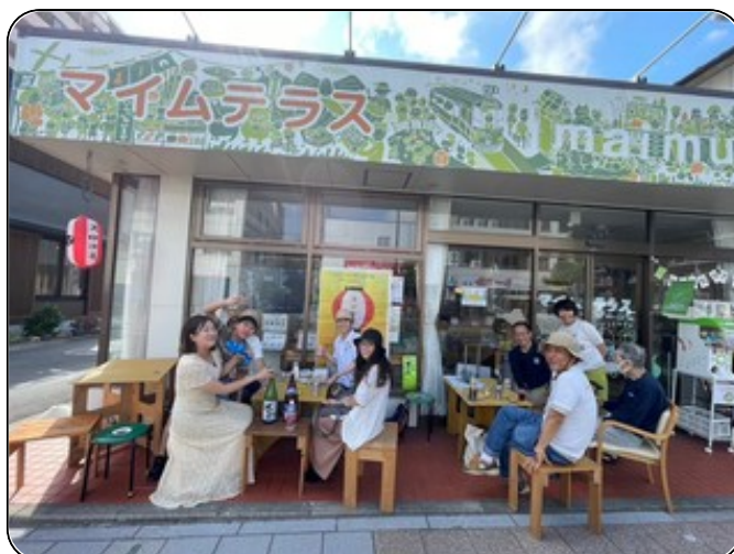
▲スロコミの運営する「マイムテラス」

毎月第3土曜日に、交流の場としてコーヒー焙煎部を開催。地域の人たちが交流したり、併設された介護施設の高齢者たちが、何となく交流の輪に混ざって、施設の中に閉じこもりがちな高齢者と地域の人との交流が生まれたりしています。