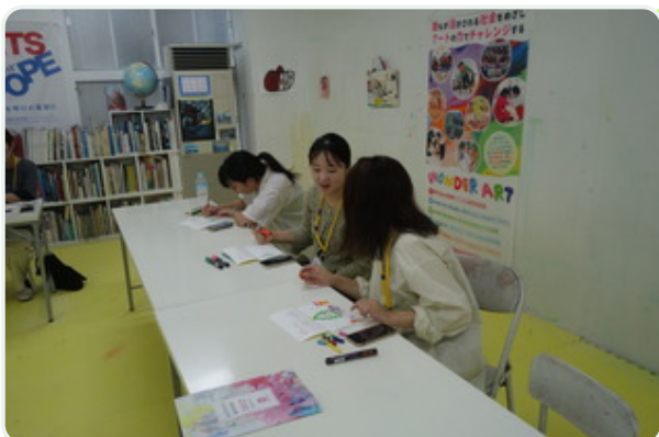
▲クリスマスカードづくりの様子