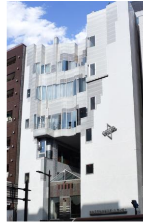
市民活動サポートセンター 外観