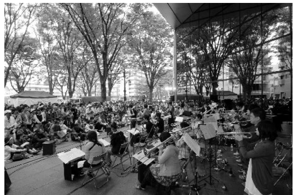
▲ 今年の定禅寺ストリートジャズフェスティバル