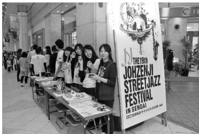
▲活動を支えているボランティアの皆さん

こういった苦勞の末にお祭りが成功すると、関わった人たちは、何とも言えない達成感を得るといいます。会社のようなピラミッド型の組織ではなかなか味わうことが難しい感覚ですね。