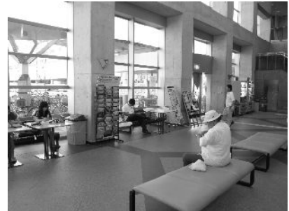
▲人々が行きかう1階ホールに設置された骨プロラック (写真中央)