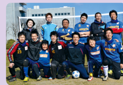
▲小学生から大人まで幅広く、県内のグラウンドで練習をしています！

将来、東北に沢山のチームが生まれ、仙台の選手がパラリンピックに出場する日がくるかもしれません。「ボー！」の掛け声は、スペイン語で「行け」の意味。見えない仲間を信じてボールを託す姿に、人を信頼することの重み、尊さを感じました。