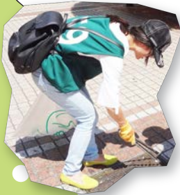
こんなにたくさん! お疲れ様でした!