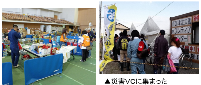
▲災害VCに集まった たくさんのボランティア

被災地の状況は日々変化しています。この度の震災においてボランティアの活躍は被災地の復旧の力となり、果たした役割も大きいものです。今後一日も早い復興のためには、被災者のニーズを的確につかみ、ボランティア活動へつなぎ、さらに次なる支援として市民活動団体・NPOへつなぐことがよりいっそう必要になってきます。サポートセンターでは、これまで蓄積してきた情報をもとに、各区のボランティアセンターや地域拠点と連携しながら、被災者や被災地の復興に向けての支援活動を行っていきます。