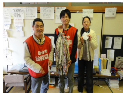
▲避難所へ渡す千羽鶴を手にするボランティアの皆さん (若林区災害VC)

災害VCでの経験をもとに、これからも被災者のニーズと市民活動団体の支援活動をつなぎながら、復興支援をしていきたいと思っています。