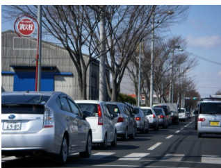
▲給油待ちの車の列と買出しに並ぶ人々(3月24日)

「個人の記録ではなく、市民共同の財産となる記録に参加できるということが受け入れられているの