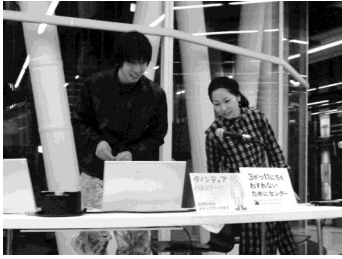
▲放送局を利用する様子