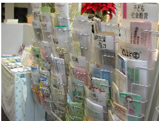
団体パンフレットは1階にあります。